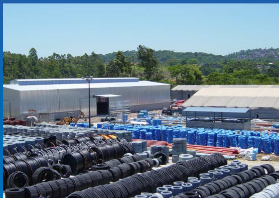
Unidade Matriz Embu das Artes / SP